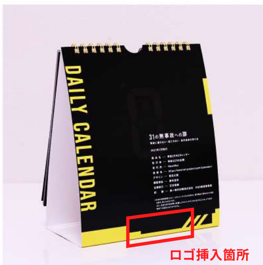
通常のカレンダー裏面