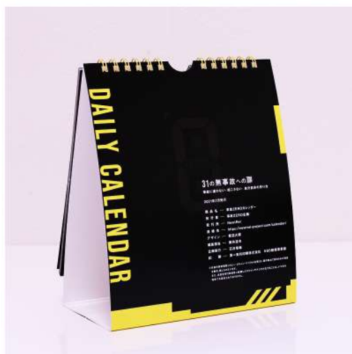
通常のカレンダー裏面